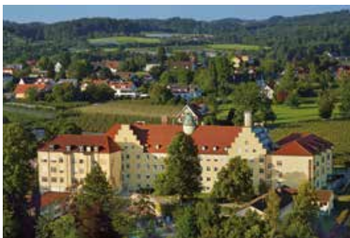
Asklepios Klinik Lindau

Ich operiere seit 20 Jahren bei erstmaligem Hüftgelenkersatz ausschließlich mit dieser Technik und habe über 4.500 Patienten mit dieser schonenden Operationsmethode behandelt.