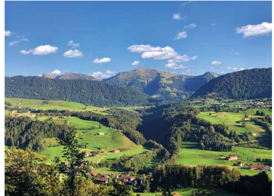
Ausblick vom Hotel Allgäu Sonne auf Hochgrat und Nagelfluhkette.

Diese Broschüre ist gültig ab Mai 2024 und verliert mit Erscheinen einer neuen Broschüre ihre Gültigkeit. Änderungen vorbehalten.