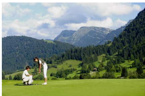
Foto ( download ): 50.000 € mit einem Schlag – das ist bei der ersten Vierplätzetournee nahe des Hotels Allgäu Sonne/Oberstaufen möglich.

unter anderem Greenfee und Verpflegung enthalten. Passende Unterkunft ist das 5-Sterne-Hotel Allgäu Sonne mit großzügiger Wellnesswelt in Oberstaufen, wo auch das Finale stattfindet. Für 5 Nächte während des Turniers kostet ein DZ/HP dort ab 750 €/Pers. www.allgaeu-sonne.de